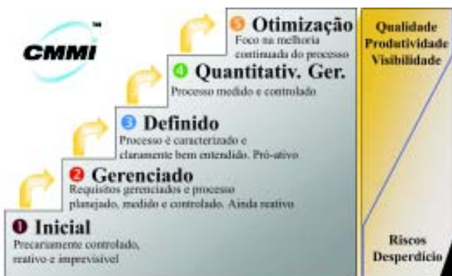
Figura 2 - O modelo CMMI - Representação por estágios.

A figura 2 ilustra o modelo CMMI em uma representação por estágios. O gráfico do lado direito indica o aumento de Qualidade, Produtividade e Visibilidade acompanhado da diminuição de Riscos e do Desperdício à medida que aumenta o nível de maturidade da organização.