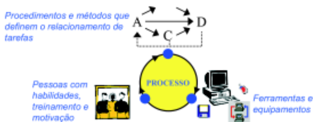
Figura 1 - Esquemática dos componentes essenciais de um processo